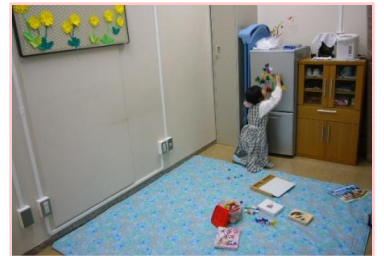
病児お預かり中の様子 マグネット遊びに夢中です!