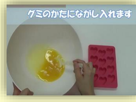
グミのかたにながし入れます