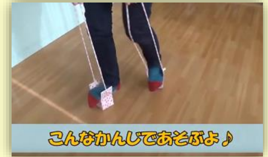
こんなかんじでおそぶよ♪