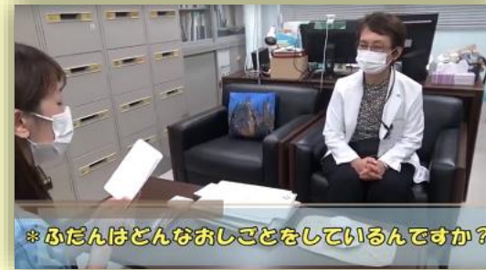
*ふだんはどんなおしごとをしているんですか?